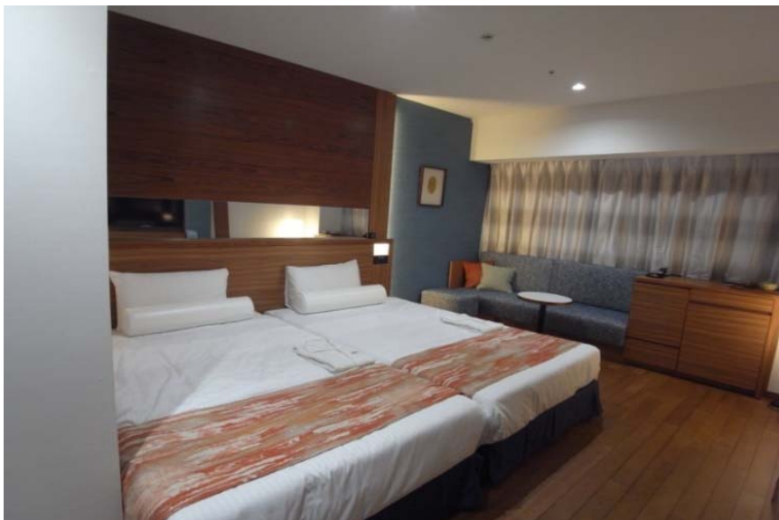
「ホテル JAL シティ那覇」客室