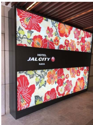
「ホテル JAL シティ那覇」 エントランス